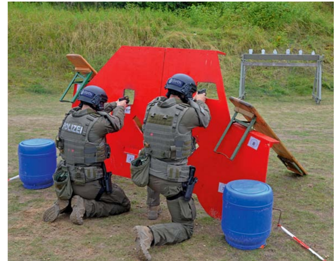
Dynamische Dekade: In diesem Jahr wird der von Frank Thiel und dem Landeskriminalamt Mecklenburg-Vorpommern organisierte „Special Forces Workshop“ (SFW) zum zehnten Mal stattfinden. Hier Impressionen von vorangegangenen Veranstaltungen.