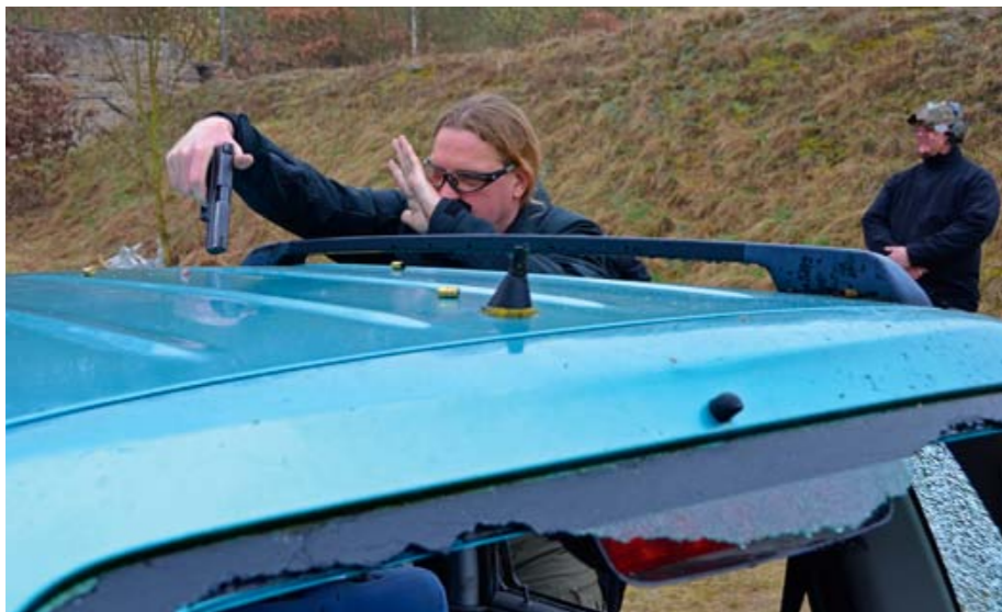
Alles Gute kommt von oben: Ballistische Materialbeschüsse mit unterschiedlichen Waffen, Kalibern und Munitionsarten gehören bei Thiels Car-Shooting-Kursen zum Standard, um in der Praxis zu verdeutlichen, was funktioniert und was nicht.